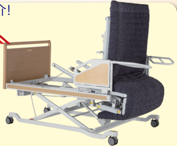
マルチポジションベッド(固定脚) 専用マットレス