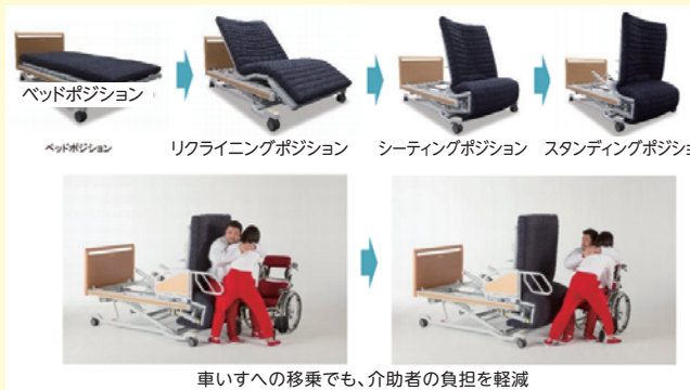
車いすへの移乗でも、介助者の負担を軽減

ベッドが椅子になって、さらに立ち上がりまでできるマルチなポジションがとれるベッド。